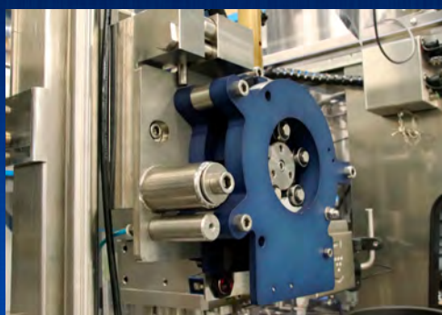
Enfoncement à pression adapté au bouchon Vinolok