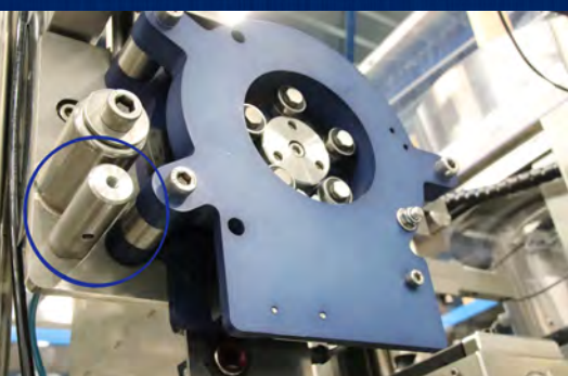
Solution d'inertage du dégarni